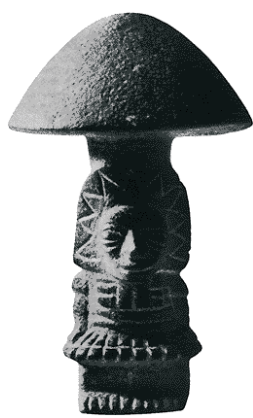
Sopra: esemplari di mushroom stones ("pietre-fungo")

Dalla fine del secolo scorso ad oggi sono stati centinaia i ritrovamenti di queste statuette, risalenti ad un periodo compreso fra il 2.000 a.C. e l'800-900 d.C.